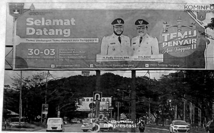
BALIHO selamat datang bagi peserta Temu Penyair Asia Tenggara yang terpasang di kawasan Bandara Internasional Minangkabau.

Hal ini terungkap dalam rapat teknis persiapan penyelenggaraan TPAT yang berlangsung Rabu